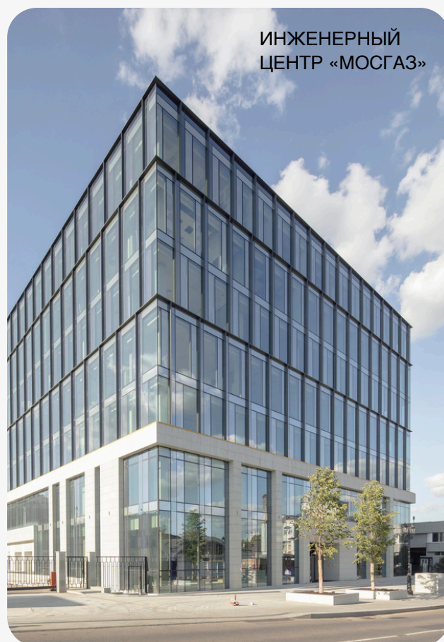
ИНЖЕНЕРНЫЙ ЦЕНТР «МОСГАЗ»